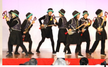
演芸発表会出演の皆さん

また、11月10日から開かれた作品展示部門「あらたま作品展」には、盆栽・陶芸・絵画の特別展示を始め、自治会やサロン活動など422名の皆さんから大小約800点の作品が寄せられ、約2週間の期間中、延べ約430人が来場し共に盛会裏に開催されました。