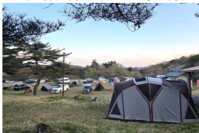
「飛ヶ森」5月連休の賑わい