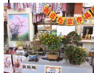
市民センター館内の展示コーナー

作品の展覧や出演並びに大会の準備から運営全般にわたりご協力頂きました多くの方々に感謝申し上げます。