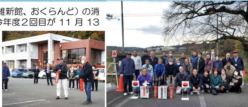
初期消火訓練と消防訓練に参加した皆さん（市民センター前庭）

この日は、開催中の「あらたま作品展」の来場者や「奥玉地区民芸大会」の会場準備係の皆さん約30名も参加して、消防訓練が行われました。警報器・非常ベルの鳴動や館内放送による避難指示、避難誘導などのほか消防署への連絡通報、初期消火訓練も行いました。