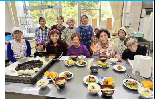
「料理講座」参加の皆さん（奥玉市民センター）