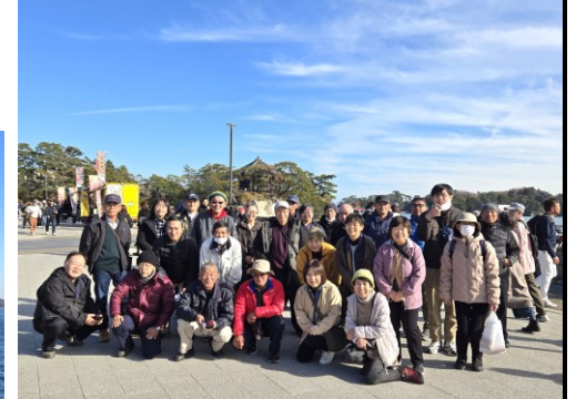
研修旅行参加の皆さん（松島「五大堂」前）