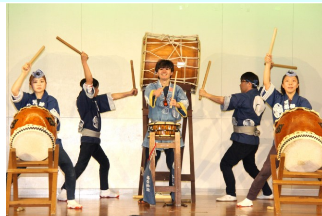
特別出演「一関 時の太鼓顕彰会」の皆さんの演奏

出店関係では、キッチンカーや露店のほか、小学6年生によるチャレンジショップ、おくたま農産、ひびきコーヒーなどの出展ブースも賑わいを見せていました。