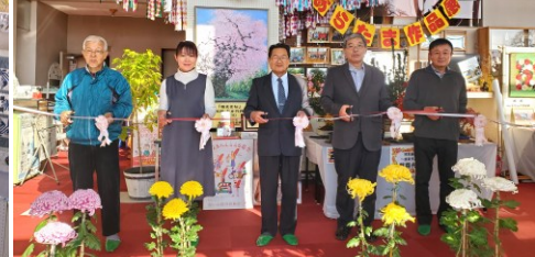
「あらたま作品展」の開場式テープカット

新年を共に祝い、地区民の親睦と交流を図ることを目的に『奥玉地区新年交賀会』開催します。みなさま、お誘いあわせのうえ、多数ご参加下さるようお知らせいたします。