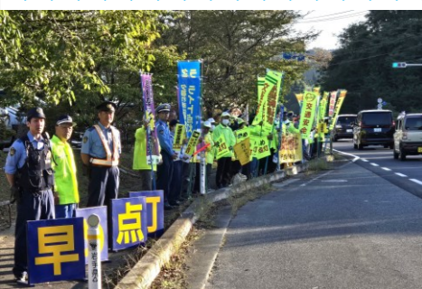
国道 284 号の人垣作戦（エスピア前）

また、千厩警察署管内の取り組みとして 9 月 26 日には、千厩と東山地域の 2 カ所で「ストップ・ザ・死亡事故 メインルート人垣作戦」が行われました。千厩地域では、国道 284 号沿いの千厩ショッピングモールエスピア前で、交通安全関係機関・団体等から約 80 人が参加し、のぼり旗やプラカードを掲げ、行き交う車両に「ライトの早め点灯」や「安全運転の励行」などを呼びかけました。