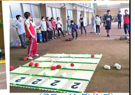
(スローイングビンゴ)