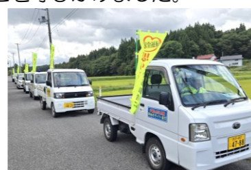
啓発活動の車両とパレードの参加者

この日は、奥玉分会役員のほか自治会、市交通指導隊、奥玉駐在所などから交通安全関係者約 20 名が参加し、交通標語入りのぼり旗やマグネット板を装着した車両 11 台に分乗し、市交通広報車を先導に奥玉地区内を巡回するコースで午前中の啓発活動が行われました。