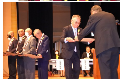
交通栄誉章・緑十字銅章の表彰受賞者