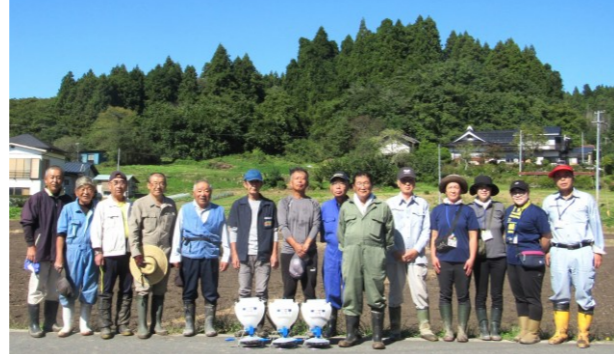
ナタネ播種作業の参加者（町下地内）

この事業の当初は、ナタネの収穫や菜種油の精油なども試みましたが、費用や手間の関係から方針を見直し、地元自治会と共催した菜の花鑑賞会や音楽イベントなどに取り組みながら地域景観の維持に努めています。