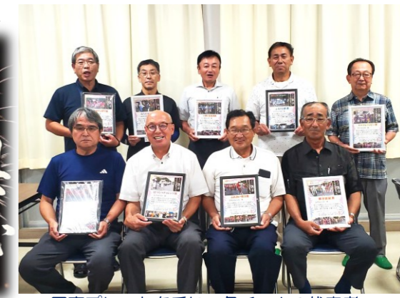
写真プレートを手に 各チームの代表者