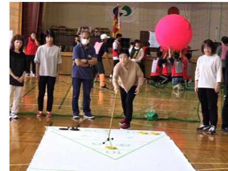
(シャッフルボード)