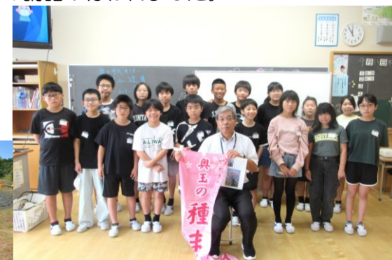
千厩小の出前講話 6 年生の子供たちと共に