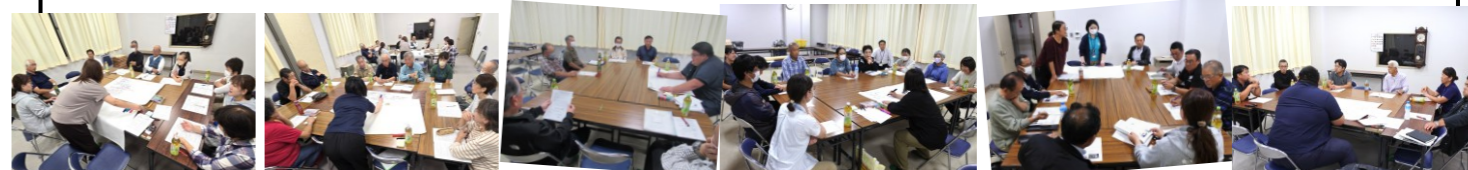
2 日間で約 60 名が参加した「あらたま談義」、各テーブルに分かれて話し合いが行われました。